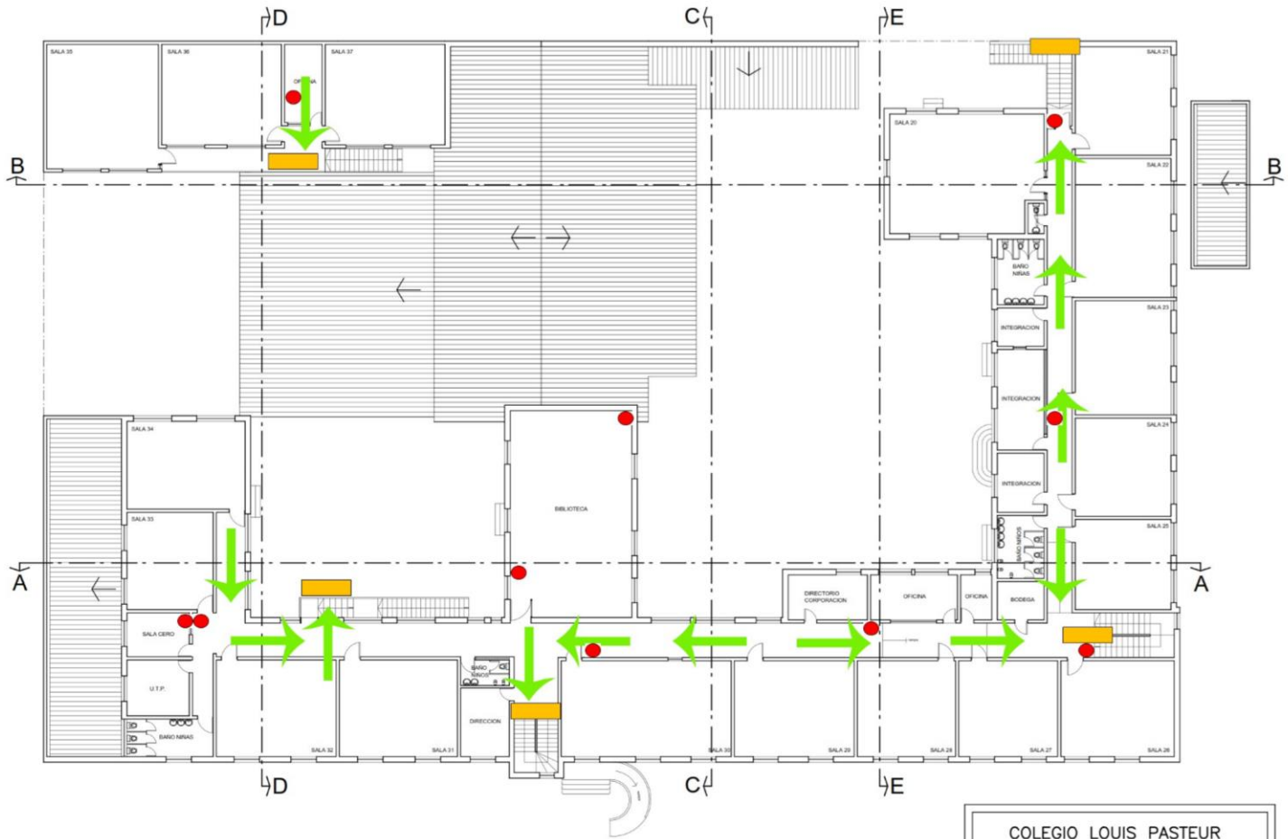
PLANTA DE ARQUITECTURA SEGUNDO NIVEL